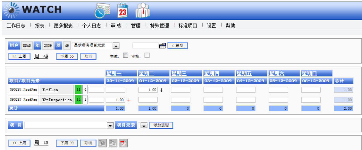
图 4 工时表例子

在每个星期的周末，当用户完成小时登记，员工选择“完成”。当管理者批准，管理者可以选择“审核”。